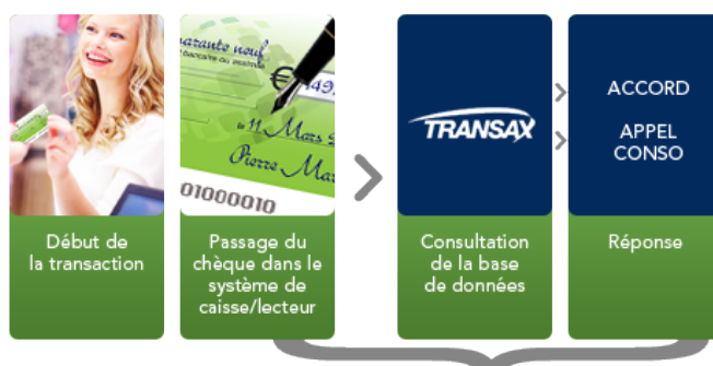
Schéma : Exemple d'une transaction par chèque en caisse Temps de réponse moyen : 2 secondes

« Je suis très satisfait du fonctionnement de TRANSAX que je recommande ainsi que de la disponibilité et de la réactivité de son équipe commerciale et technique »